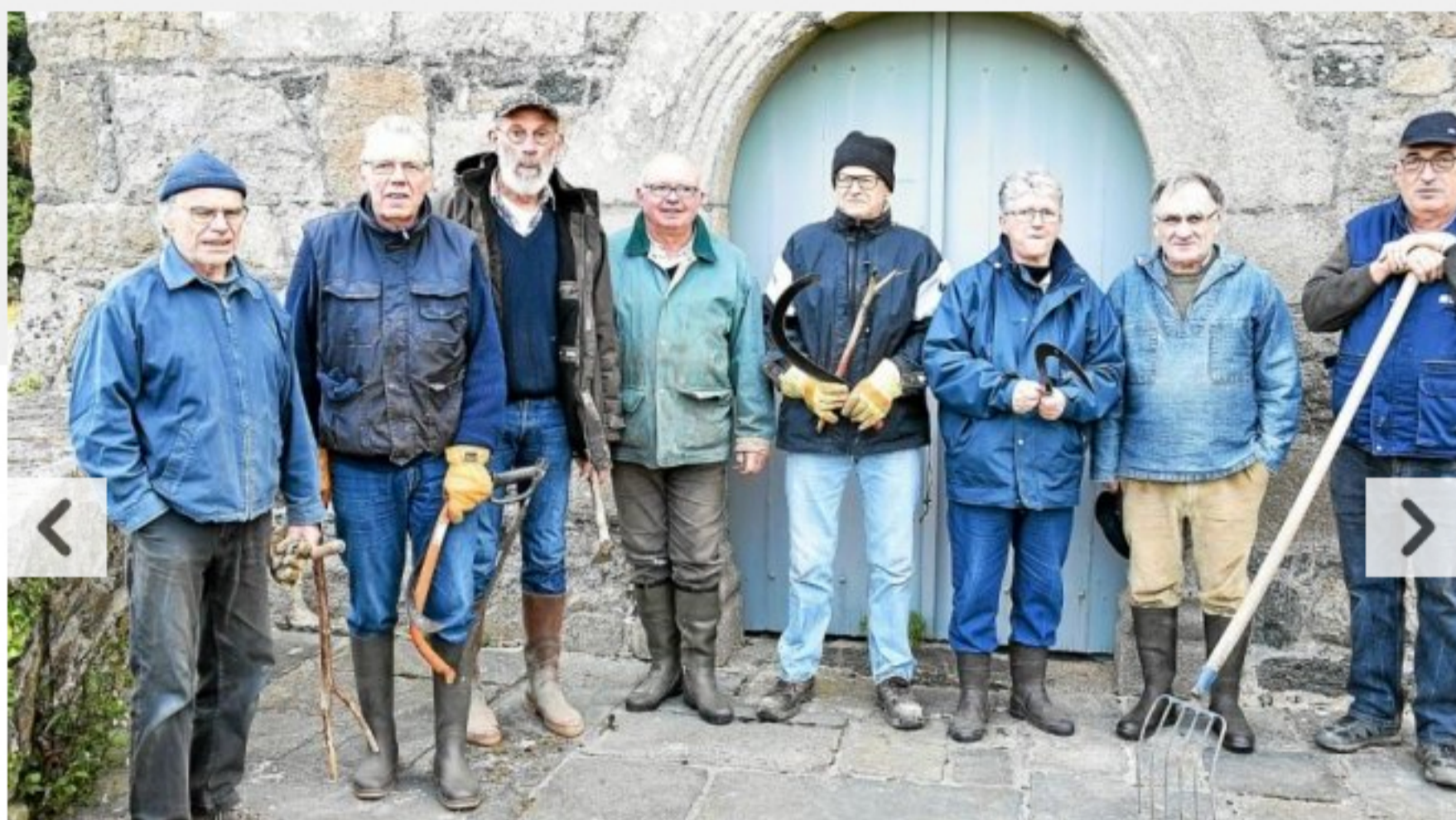
Environnement. Les « nettoyeurs » du week-end

🕒 Publié le 13 avril 2019 à 15h35 Modifié le 13 avril 2019 à 15h36 VOIR LES COMMENTAIRES